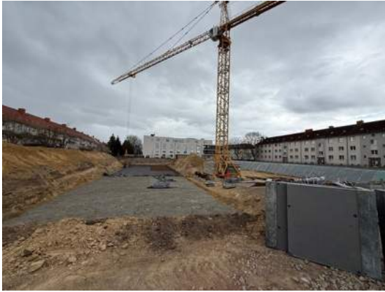
Aufbau Kran und Sauberkeitsschicht