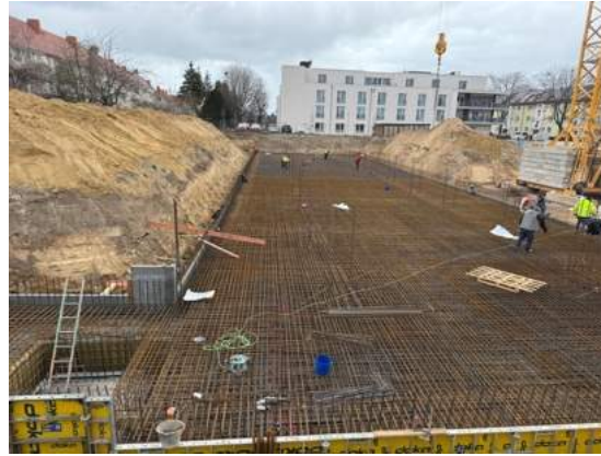
Vorbereitung Bewahrung Bodenplatte Haus 2