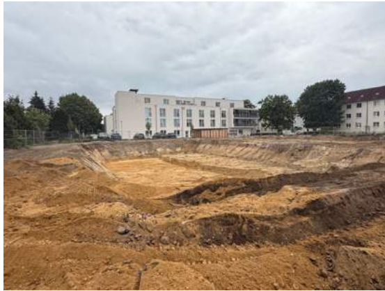
Baugruben sind ausgehoben