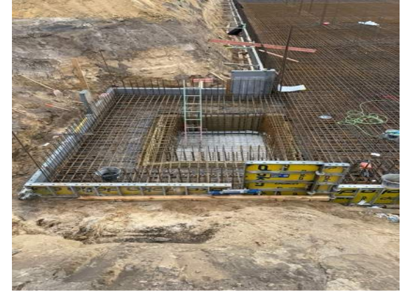
Unterfahrt Aufzug Haus 2