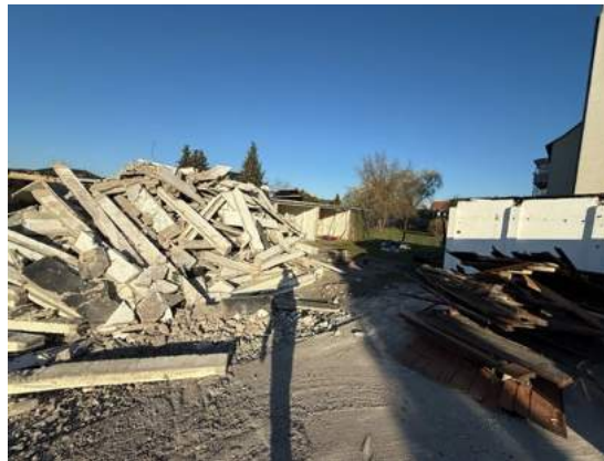
Abbruch der Garagen