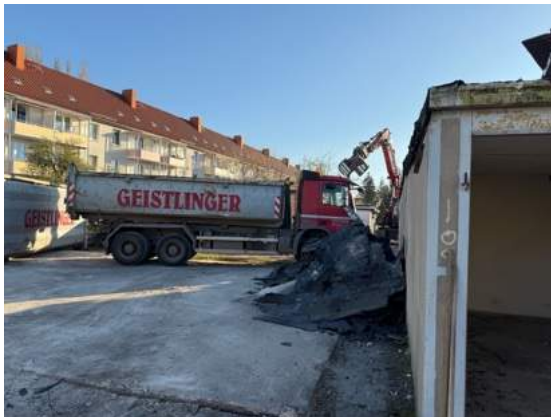
Abbruch der Garagen