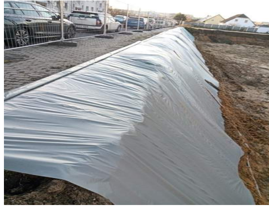
Baugrube gegen Abrutschen geschützt