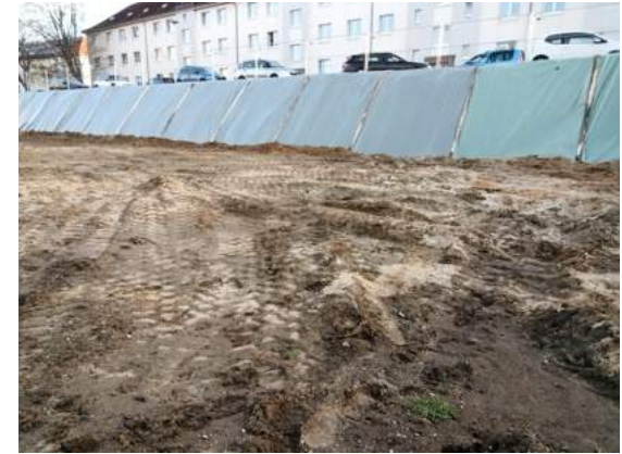
Baugrube gegen Abrutschen geschützt